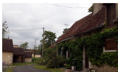
Bâti rural patrimonial à Douadic