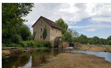
Moulin à Concremiers