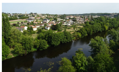
Vue sur Le Blanc depuis le viaduc

Plus de 13 communes visitées lors des itinéraires du PLUi (visites thématiques des différentes communes du territoire à la rencontre des initiatives et des paysages)