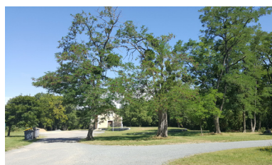
Ancienne gare d'Ingrandes